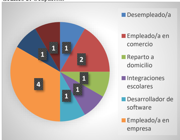
Grafico 3. Ocupación.